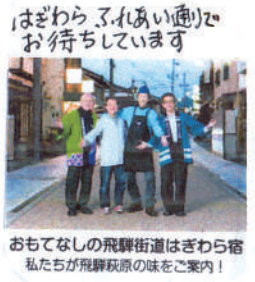
おもてなしの飛騨街道はぎわら宿 私たちが飛騨萩原の味をご案内！