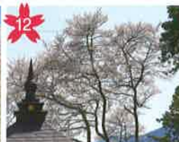
慈雲寺のしだれ桜 山之口地区にあり、他の桜と違い開花時期は4月下旬頃になります。 *開花予想/4月下旬頃。 *飛騨萩原駅から「げるバス」川西北線利用。