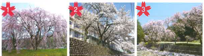
中呂のしだれ桜 禅昌寺近く中呂地区の国道41号沿いにあるしだれ桜。 *開花予想/4月中旬頃。 *禅昌寺駅から徒歩5分。