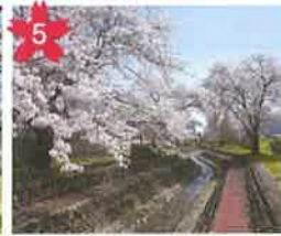
あさぎりスポーツ公園の桜 公園西側の小川沿いにあり、利用者憩いの場所。歩行者専用の橋で飛騨川公園とつながります。 *開花予想/4月中旬頃。 *飛騨萩原駅から徒歩25分。