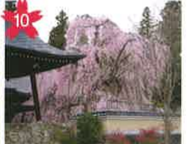
白山の桜 白山公園の中に入り、道路からも良く見えます。ライトアップあり。 *開花予想/4月中旬頃。 *飛騨萩原駅から「げるバス」川西北線利用。