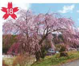
南ひだ健康道場のしだれ桜 ここでは色々な健康チェックや体験学習ができます。ライトアップあり。(火曜日休み) *開花予想/4月中旬頃。 *飛騨萩原駅から「げるバス」川西北線利用。