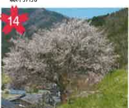
岩太郎のしだれ桜 通行人に覆いかぶさるように咲く姿は見ごたえがあります。ライトアップあり。 *開花予想/4月中旬頃。 *飛騨萩原駅から「げるバス」川西北線利用。