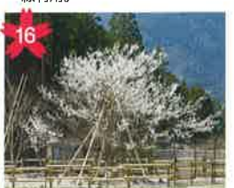
森山神社のしだれ桜 四美地区の鎮守・森山神社のしだれ桜。ライトアップあり。 *開花予想/4月中旬頃。 *飛騨萩原駅から「げるバス」川西北線利用。