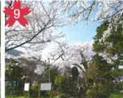
薬師様の桜 小高い場所の公園にあり、地元の花見スポットです。ライトアップあり。 *開花予想/4月中旬頃。 *飛騨萩原駅から「げるバス」川西北線利用。