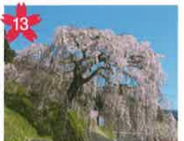
梵音堂の桜 梵音堂の前にひっそりと咲く樹齢100年、たくさん集まる小鳥の憩いの桜。近くには延命水も湧く。 *開花予想/4月中旬頃。 *飛騨萩原駅から「げるバス」川西北線利用。