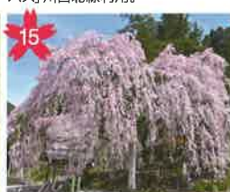
銀の山桜 樹齢100年の山桜。散り始めの赤い若葉とのコントラストもきれい。ライトアップあり。 *開花予想/4月中旬頃。 *飛騨萩原駅から「げるバス」川西北線利用。