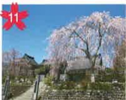
永養寺のしだれ桜 鐘つき堂の脇にしだれ桜、寺の門の前に波瀾桜があります。ライトアップあり。 *開花予想/4月中旬頃。 *飛騨萩原駅から「げるバス」川西北線利用。