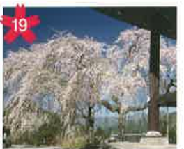
小林のしだれ桜 奥田洞地区にあり、開花当初は濃いピンク色ですが徐々に淡いピンクへと変化する桜です。 *開花予想/4月中旬頃。 *濃飛バス下呂小坂・高山線「赤岩バス停」下車、徒歩20分。