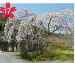
平成天皇陛下皇后陛下お手植え樹 「第57回全国植樹祭」で平成天皇皇后陛下にお手植えいただいた桜。現在は「皇樹の杜」として整備された敷地内にたたく。*開花予想/4月中旬頃。 *飛騨萩原駅から「げるバス」川西北線利用。