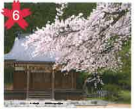
神通堂の桜 神通堂にある桜。神通堂は宮谷神社の南にある観音堂です。 *開花予想/4月中旬頃。 *飛騨萩原駅から「げるバス」川西北線利用。