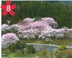
宮谷の桜 宮谷神明神社の近くにある桜。ライトアップによる水田に映る姿は見事です。 *開花予想/4月中旬頃。 *飛騨萩原駅から「げるバス」川西北線利用。