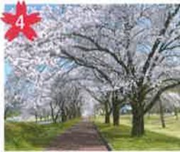
飛騨川公園の桜 広い河川敷公園内に数多くの桜を楽しむながら、休憩・散歩・軽スポーツにどうぞ！ *開花予想/4月中旬頃。 *飛騨萩原駅から濃飛バス下呂小坂・高山線利用。